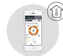
Onix Connect Vertical

CONTROLE À DISTÂNCIA COM COZYTOUCH APP Cozytouch App é gratuita e pode ser descarregada na Apple Store ou no Google Play (Mais informação na pág. 14)