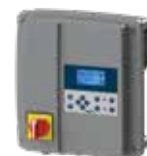
Painel de controlo Smart