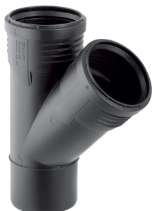
Imagem de exemplo