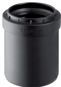
Imagem de exemplo